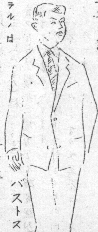
マルヤマときました。たり 丸山洋服店

すり傷程度ならば、自然治 癒力によつて放っておいて も治ります。か、こと 病気……いわんや慢性 病となると、どっこいそ 目行きません マクネタイザーで根本的病源治療を なさいませ