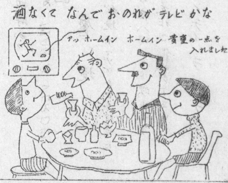
酒なくて なんておのれがテレビかな アッ、ホームイン ホームイン 貴重の一点を 入れました

カクメント用の鮮魚はサントスの大問屋から参りますから、お安くお上げます。のみものも大勉強、コッポ大血などの用意もありません