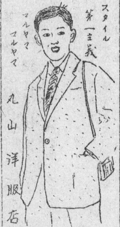
スタイル 第一主義 丸山洋服店