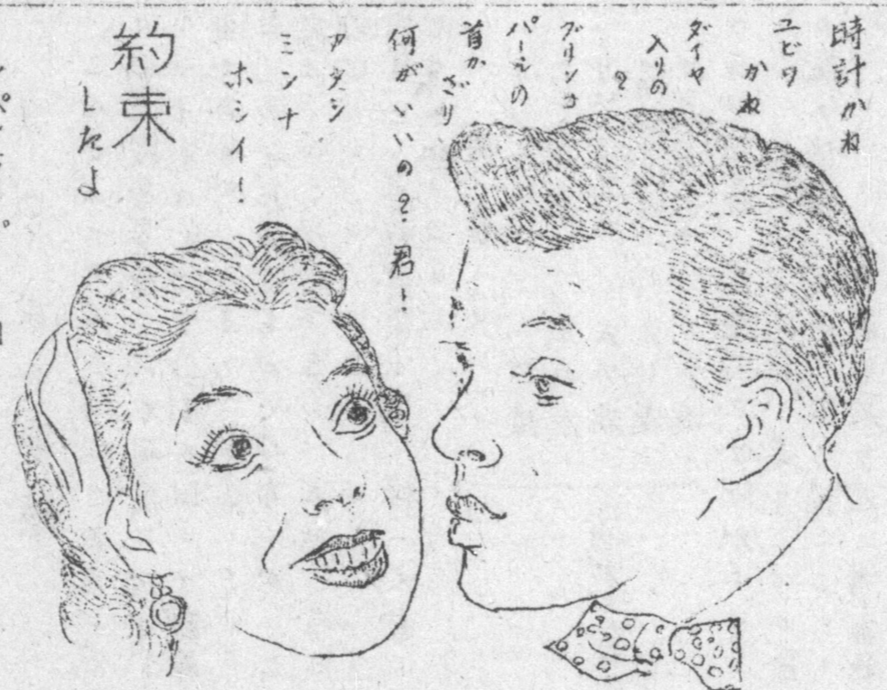
Reloaria Confianca Tupã