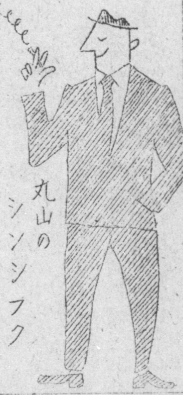
丸山のシンシブク