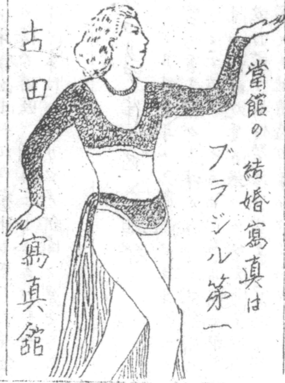
當館の結婚寫真は ブラジル第一