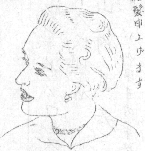
Novidade Typo "Samson"

此度び市の有名者の方達が 私の美容院に マルタ・ロトシア と云ふ名をつけて 下さいました。 名に背かぬ様一心に 結髪申上ります