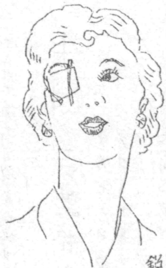
銘言 眼美しか うずうずして 佳人という を得んや

再三御報らせ申上げますとウリ 真下先生の御帰国時期が追々迫って 参りますので、治療をなさる方は御繰合 せ、御来院下さい。 トラフォーム・サカマツケ・セイシユ前膜 等少くも二週間を要しますから、その御つ もりで御早くお出でを願ひます。