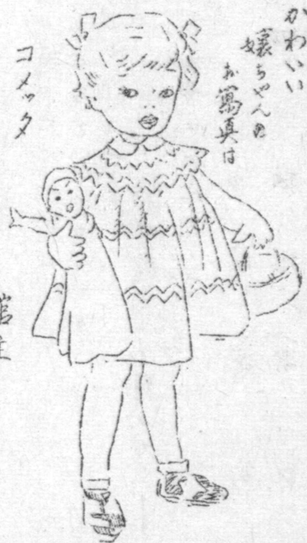
写真館で 館主 古田正史

一、診察は無料といふのを有料にする 一、経費負担額を極力少くする 一、組合員を正組合と準組合に分つ 一、正組合員は組合が必要とする施設をする爲め定額の出資を行ひ、組合費に對し持分権を有す