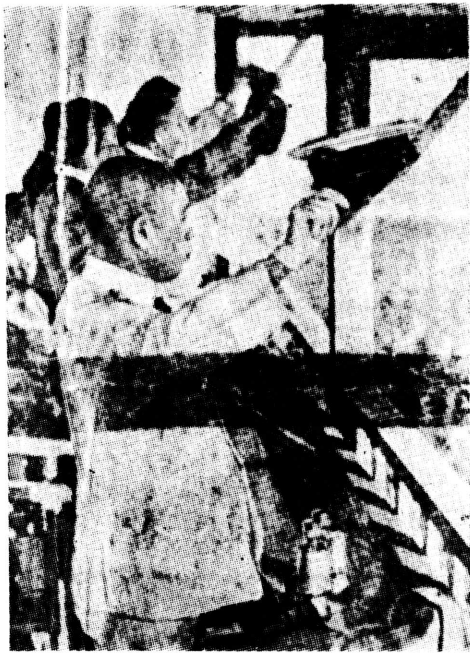
海鷲を見送る山本元帥