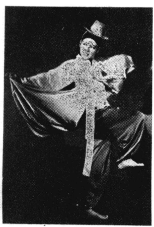
（一）政治思想の危険な群衆集

【紐育十三日ユピール電】「紐育力」として、大統領の演説は、全米に波紋をよげた。大統領は、演説の中で、北米諸邦に對する米國の政策を述べ、米國の利益を保護することを誓ひ、米國の統一を維持することを述べた。 大統領の演説は、北米諸邦に對する米國の政策を述べ、米國の利益を保護することを誓ひ、米國の統一を維持することを述べた。