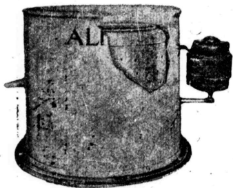
Centrifuga ALFA para accionamiento a motor eléctrico.

Entre nuestra clientela japonesa, que ha instalado ya estas máquinas, que trabajan a completa satisfacción, se hallan los siguientes: