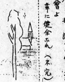
總會日の登場役者を評す (前頁よりつづく)

「さあ何時に帰るかは歸つて来る事か、まあ貴女が帰つて下さい。それよりもこれから前さんといふと働かざるはあつちやあつちやだ。お前さんにはこれ三千ペソの元手が掛つたんだから、日と極めて冷波に云はれた時彼女は絶望から蹴落されたやうに感じた。 其時始めて彼女が晒されて居る事を知りた事は彼女に取つて一生忘れ難い出来事だ。怖ろしいまた思慮の夜心であつた。 悪妻から醒めて高い窓から這入つて来る薄い光線の下に半裸体になつて床の上に横つて居る自らを見た時彼は再び自分に抱まつた。泣き止まない運命を考へるやうに泣いたのである。(續く)