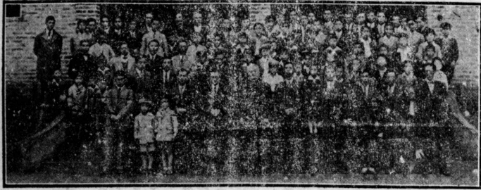
式戴推長校譽名藤佐の園學コスシンラフ・ンサ