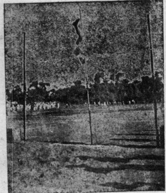
七月十七日舉行された豫選入會の成績は...

「あ、あのね、スチュー...」 「飛行機を貸して...」 「お母さん、お母さん...」