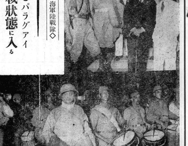
ボリヴィア軍の海軍陸戦隊